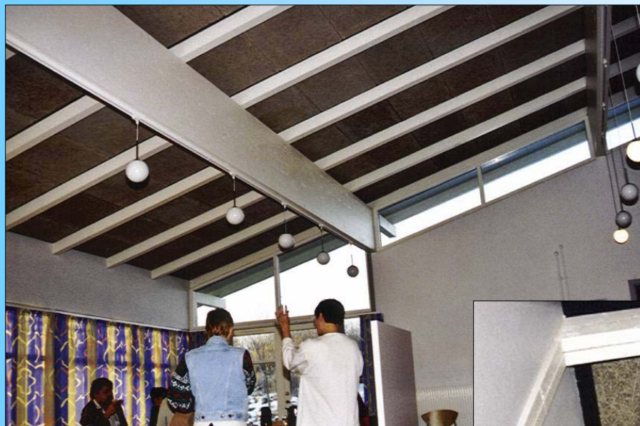
Aktivitetshuset "Charlotteager", Hedehusene

Fibrolith træbeton , grå, grov uld med fas