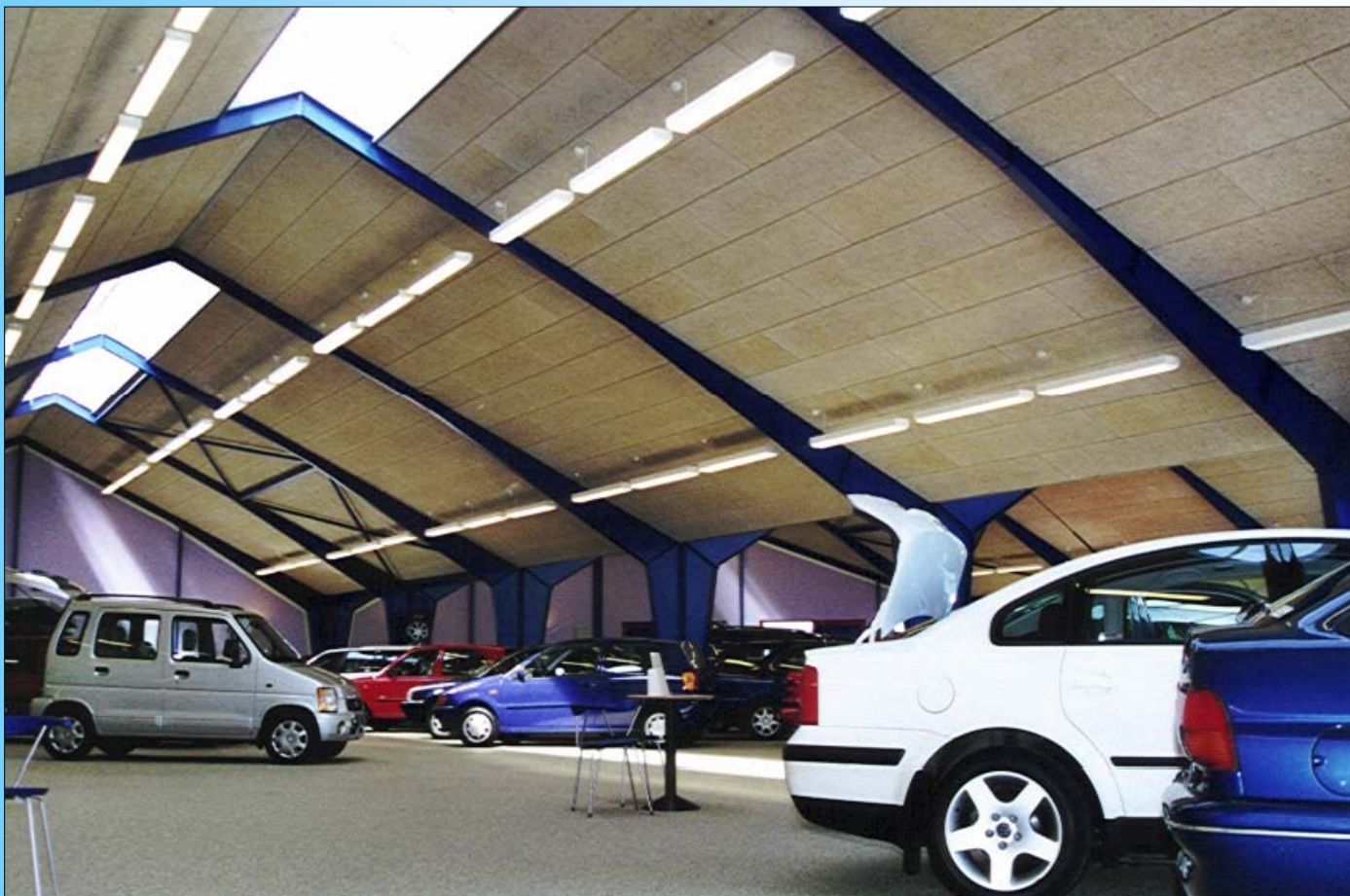
Udstillingshal, Scotwin Auto , Roskilde

Loftbeklædning af Fibrolith træbeton , lys fin uld med fas