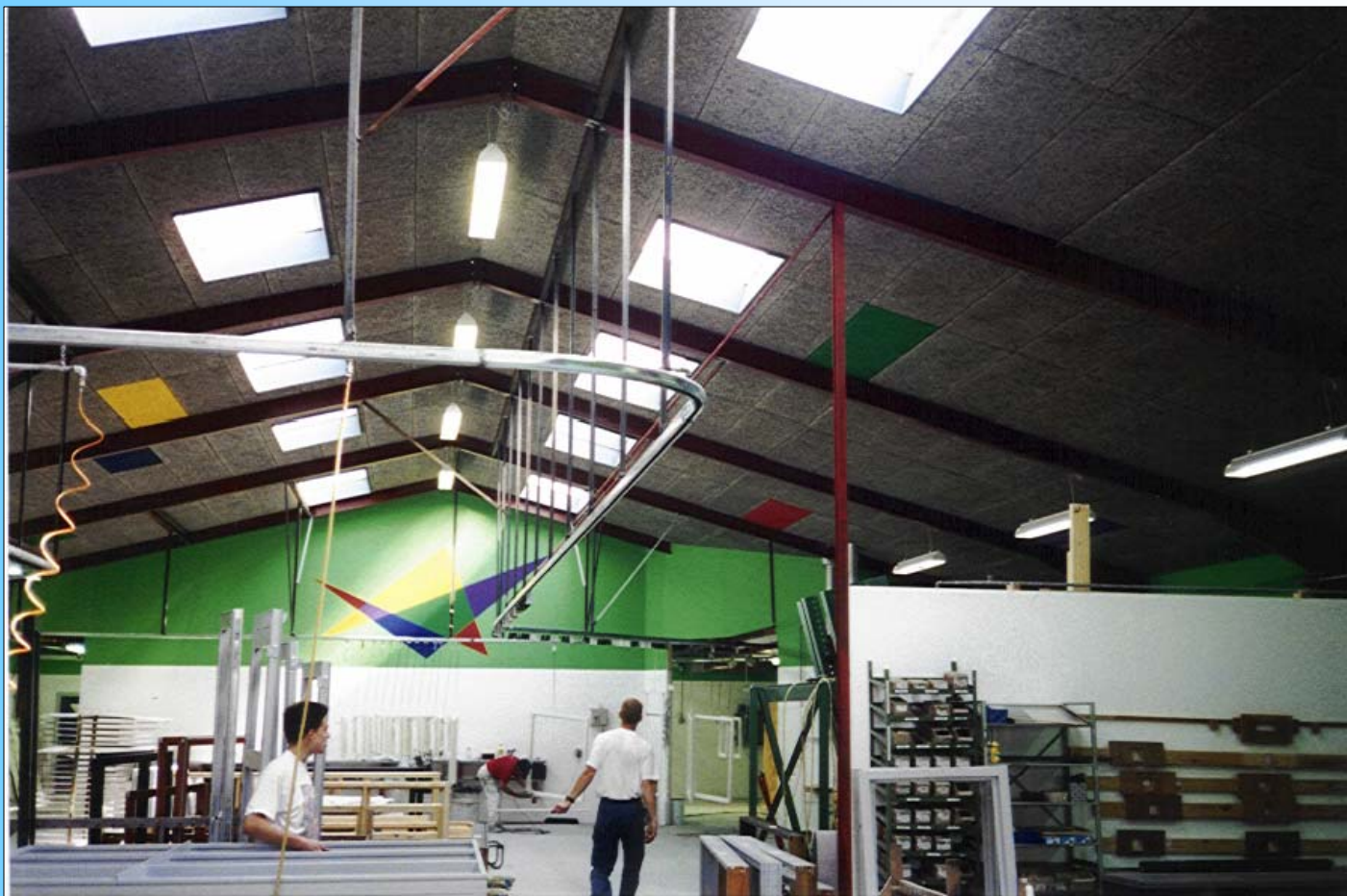
Produktionshal Total døre & Vinduer , Munkebo

Loftbeklædning af Fibrolith træbeton , grå, grovuld med fas